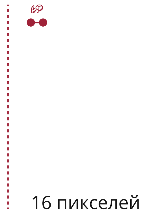
Минимальный размер лого